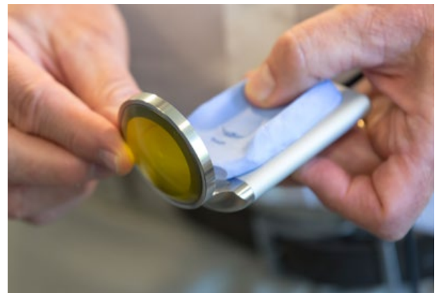
Elastische Membran mit Olivenöl als Kupplungsflüssigkeit: Drückmesser von Veinpress für die Messung des zentralen Venendrucks.